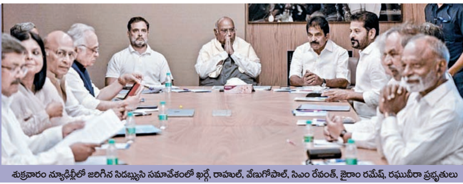
శుక్రవారం న్యూఢిల్లీలో జరిగిన సిడబ్ల్యుసీ సమావేశంలో ఖార్, రావాలర్, వేణుగోపాల్, సిఎం రేవంత్, జైరాం రమేష్, రఘుపతి ప్రకాశ్ తులు

నియోజకవర్గాల పునర్విభజన వల్ల దక్షిణాదికి తీరని నష్టం మహిళా లింగవ్యతనకు డీలిమిటేషన్ తో ఎందుకు లింక్? ప్రస్తుత సీట్లతోనే లింగవ్యతన ఇవ్వచ్చు ప్రాంతాల మధ్య అసమానతలకే కేంద్రం చర్యలు